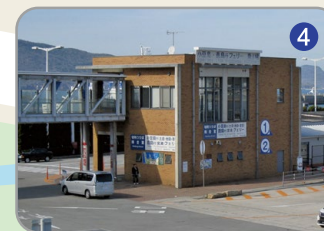
▲フェリー切符売場