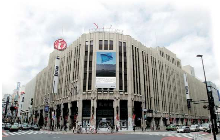
※店舗装飾イメージ

◆三越関係店舗：芸術祭と猪熊弦一郎（芸術祭参加作家、香川県出身）作の三越包装紙「華ひらく」等をテーマにした店舗内外の展示、装飾等の実施（写真家ホンマタカシによるコラボ作品含む）