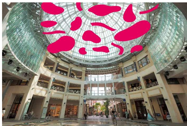
※「華ひらく」立体巨大アート イメージ