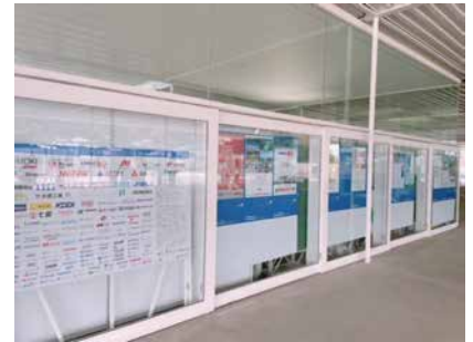
設置時の様子 (直島 / 宮浦港)