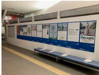
設置時の様子 (高松港)