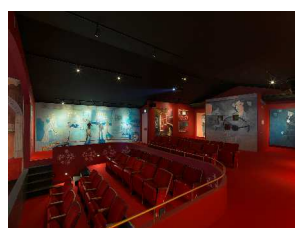
依田 洋一朗「ISLAND THEATRE MEGI『女木島名画座』」