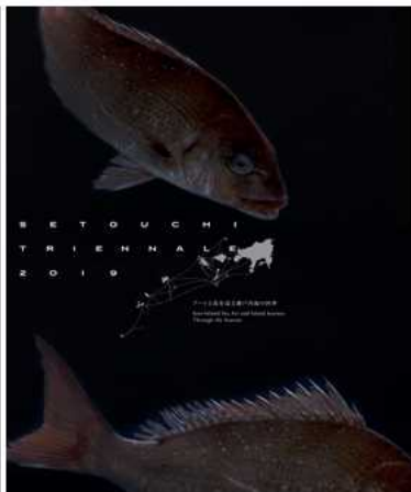
瀬戸内国際芸術祭2019 Setouchi Triennale 2019 〒760-0001 香川県高松市丸の内1-1-1 TEL: 087-8211111 FAX: 087-8211112 E: info@setouchi-artfest.jp www.setouchi-artfest.jp