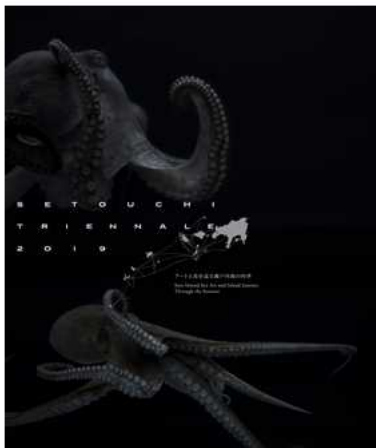
瀬戸内国際芸術祭2019 Setouchi Triennale 2019 〒760-0001 香川県高松市丸の内1-1-1 TEL: 087-8211111 FAX: 087-8211112 E: info@setouchi-artfest.jp www.setouchi-artfest.jp