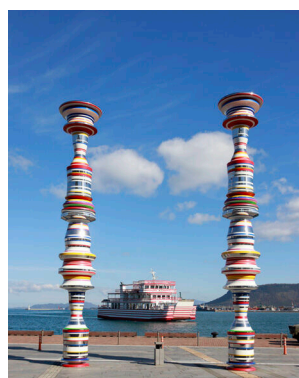
大巻伸嗣 「Liminal Air - core -」

瀬戸内国際芸術祭の趣旨に賛同して、自社のメセナやCSR・SDGs活動として瀬戸内国際芸術祭の活動を継続して支援する意向を有し、瀬戸内国際芸術祭2025に一定金額以上の支援をしていただける企業・団体等を「瀬戸内国際芸術祭パートナー」と称し、相互の協力関係を築きます。