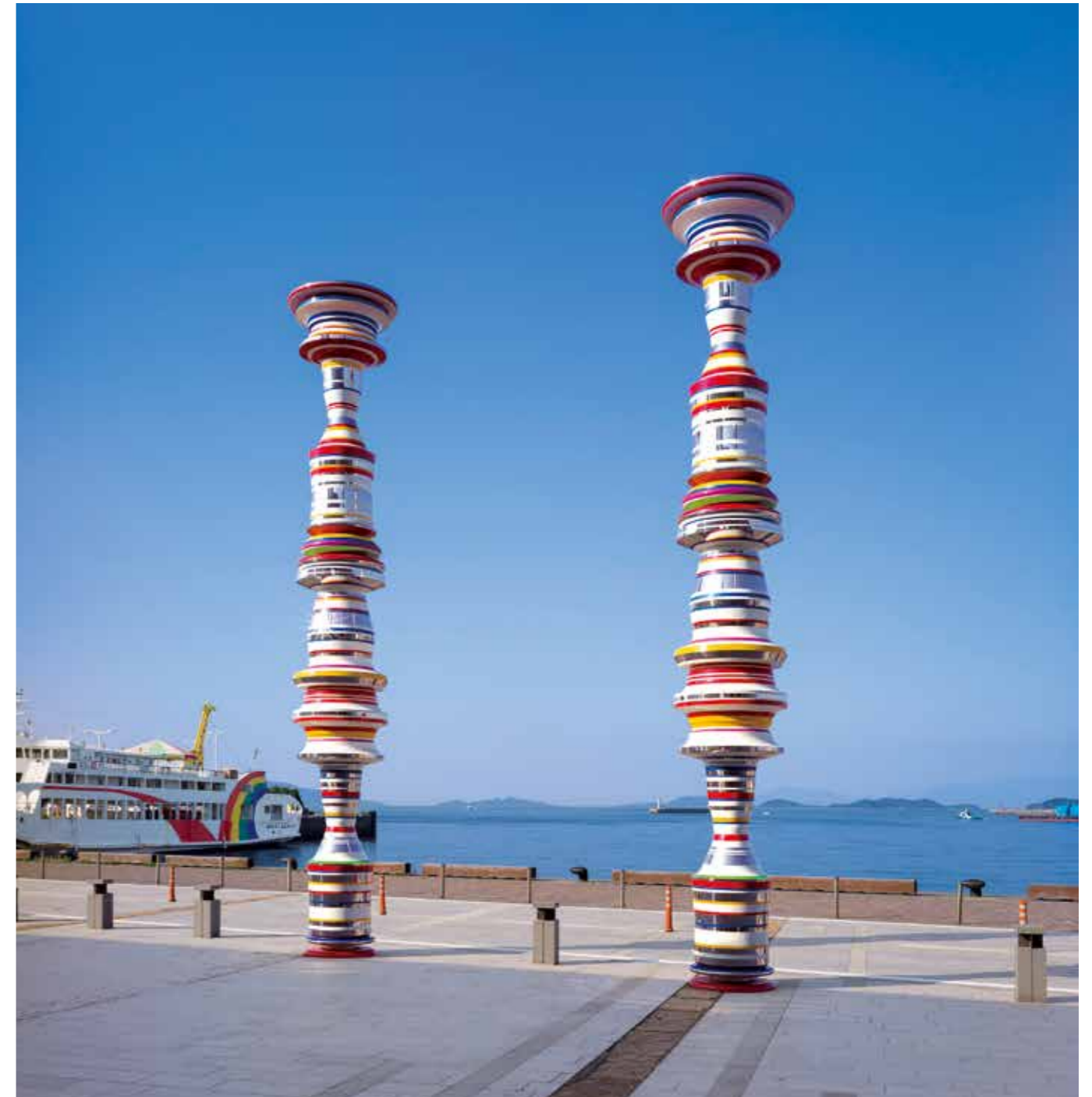
大巻伸嗣「Liminal Air -core-」