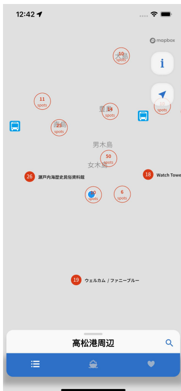
地図の読み込みが行われていない場合の画面（例）

最新バージョンにアップデートをすることで解消されますので、下記のように地図が表示されない場合には、最新バージョンにアップデートをお願いいたします。