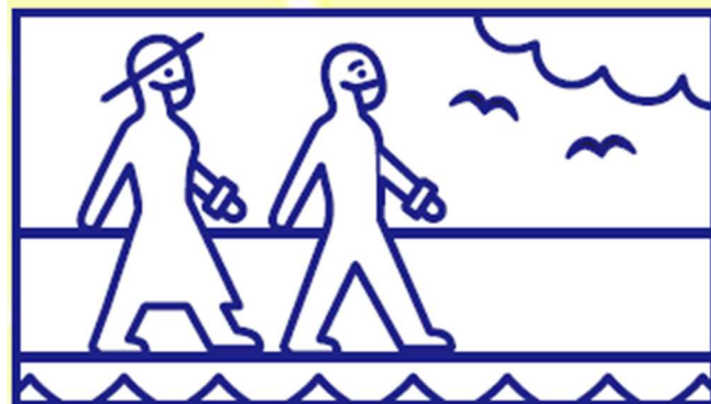
④ 感染対策&鑑賞マナーを守って、楽しく・安全に巡りましょう