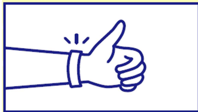
③ 施設や作品の入場時に、リストバンドを提示してください

直島：各アート施設 / 豊島：高松港・宇野港・家浦港案内所・唐櫃岡 / 女木島：高松港 / 男木島：高松港 / 小豆島：島内のアート作品付近 / 大島：高松港 / 犬島：宝伝港・犬島案内所 / 沙弥島：沙弥島案内所・与島案内所 / 本島：丸亀港・児島観光港 / 高見島：多度津港・本通アート作品付近 / 栗島：JR 詫間駅・経面臨時駐車場 / 伊吹島：観音寺港 / 高松港周辺：各アート施設 / 宇野港周辺：宇野港案内所