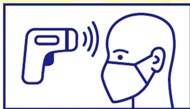
② 検温スポットに立ち寄り、リストバンドをもらってください