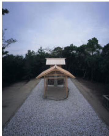
※プロジェクト「護王神社」杉本雅楽"Appropriate Proportion"